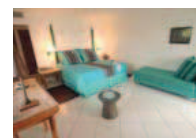
Chambre Club Nichée dans les jardins verdoyants et dotée d'une terrasse aménagée.