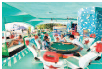
Club Med Passworld MD