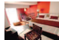
Chambre Deluxe Espace 5Ψ Chambre raffinée (39 m 2 ) avec balcon et services premium.