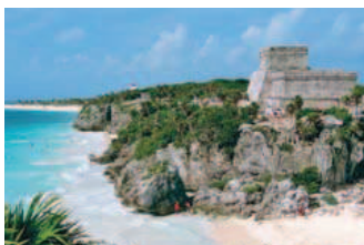
Excursion* à Tulum