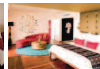
Suite Espace 5Ψ Suite raffinée (64 m 2 ) avec salon spacieux, terrasse (14 m 2 ) dominant la mer et services premium.